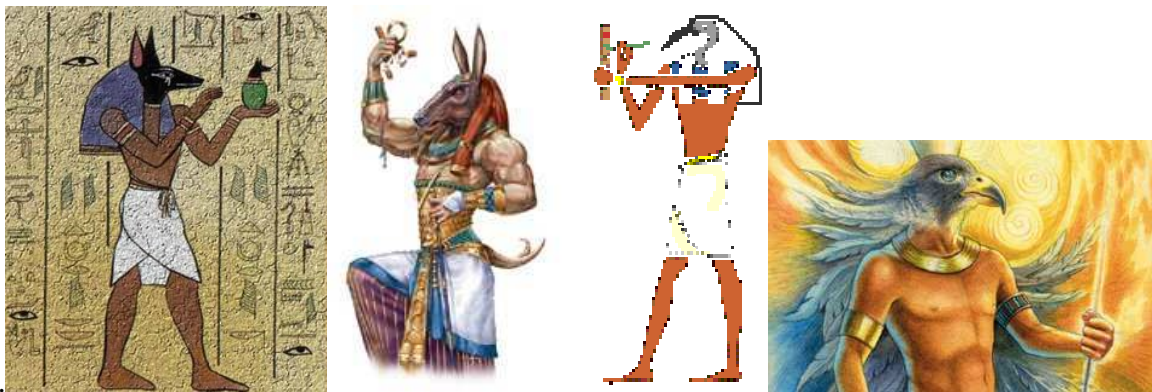
Figura 2 . Anubis, Set, Thot e Horus, deuses egípcios.

Estas divindades representavam valores, proteção e esperança para o mundo em que viviam. Pensavam os crentes do antigo Egito e de outras civilizações que, através destas figuras, o homem poderia alcançar ou almejar a evolução do espírito, o encontro com a perfeição e o conhecimento do caminho necessário para alcançar a felicidade eterna (DOTTI, 2005).