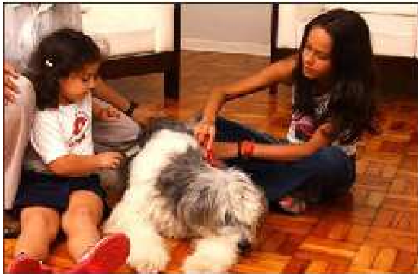
Figura 3 Terapia com animais de estimação.

Corroborando com estas pesquisas, Becker e Morton (2003, p. 29) relatam que: “através do relacionamento íntimo com os animais de estimação despertamos as outras características animais, igualmente poderosas, da lealdade, do amor, do instinto e da jovialidade.”