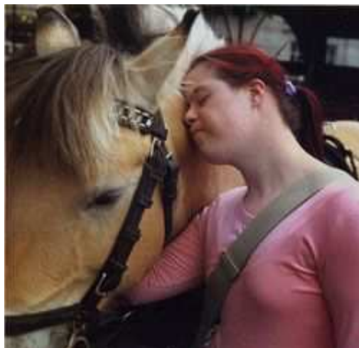
Figura 4. A equoterapia com portadores de síndrome de Down.

por meio de outras atividades e jogos, além do contato e manuseio do animal, durante toda a sessão.”