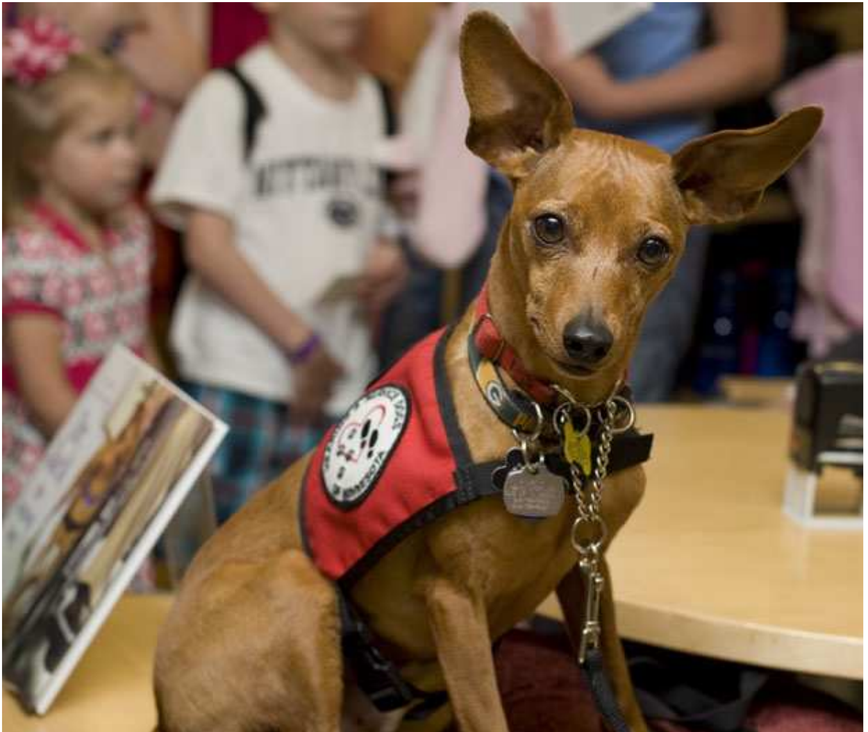
Jack, terapeuta que atende na Clínica Mayo, nos EUA

Jack não é formado em medicina nem pode ser qualificado como enfermeiro. Mas dá expediente todos os dias em um dos centros médicos mais